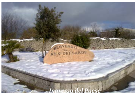
Ingresso del Paese